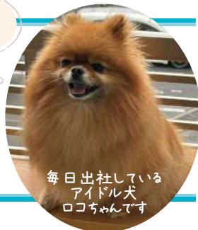
毎日 出社している アイドル犬 口ちゃんです

申請のお手伝い している私たちが ビックリするほどの 補助金です。 是非利用して下さい。 我が家も補助金利用で 快適な窓を実感済み!