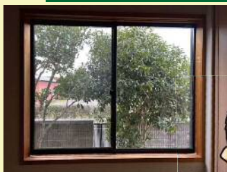
施工前 アルミサッシ+単板ガラス