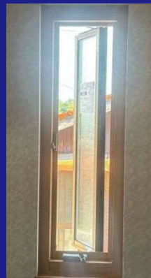
施工後 樹脂とアルミの複合サッシ Low-eペア・ガス入り 【縦こり窓】