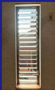
施工前 廃盤となってしまった 【ジャロジー窓】