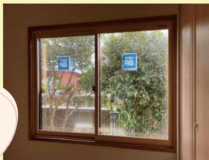
施工後 樹脂サッシ+Low-eペアガラス (アルゴンガス入り)